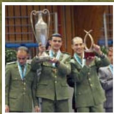
Algeria, Short Cross