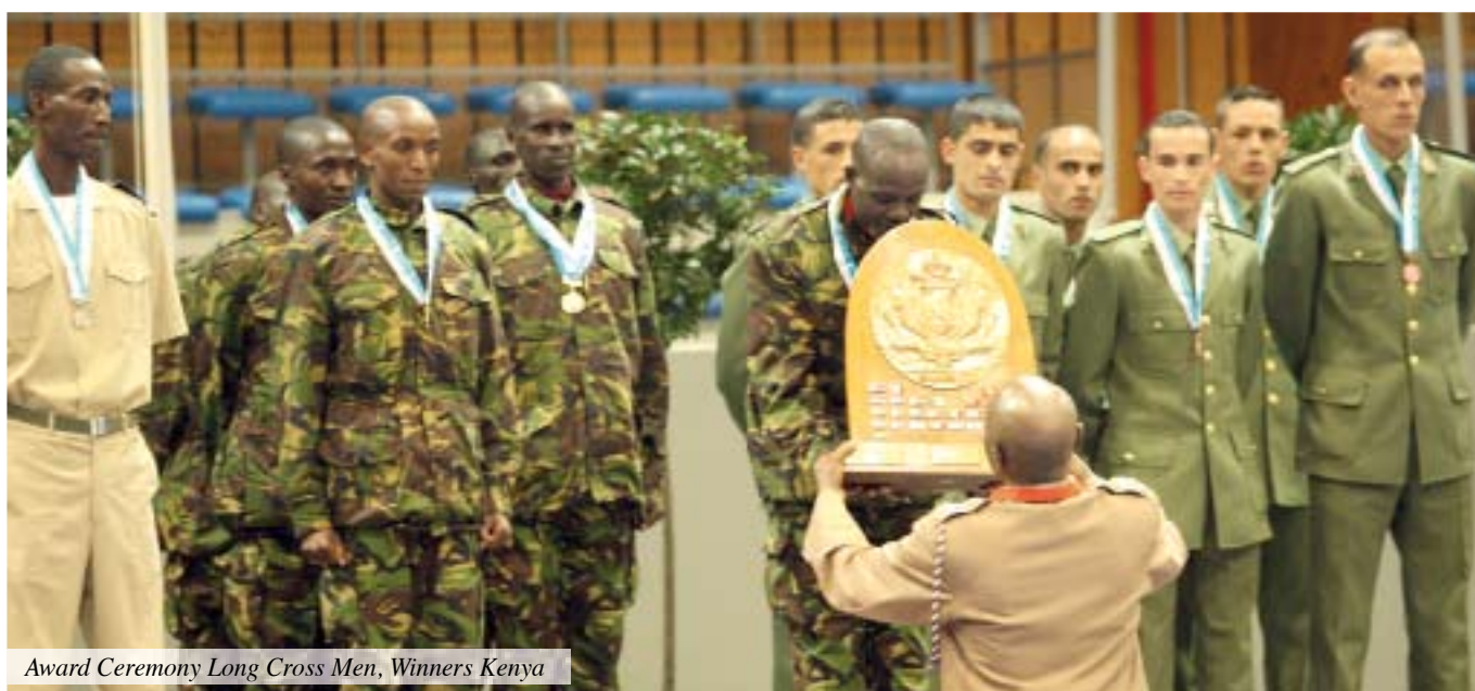
Award Ceremony Long Cross Men, Winners Kenya

Au classement des nations, le Kenya s'impose évidemment, devant les étonnants Burundais et une équipe d'Algérie très homogène. A Ostende, le Kenya sera venu. Il aura vu et il aura vaincu.