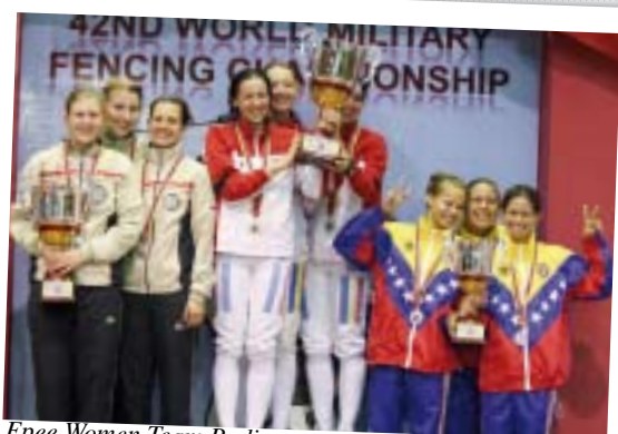
Epee Women Team Podium