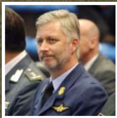
Crown Prince Philippe of Belgium