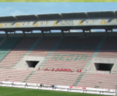
Design & Build