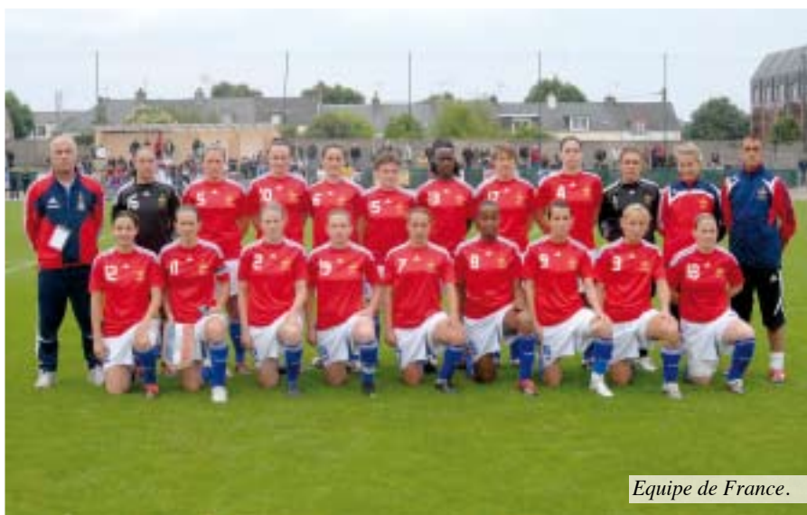
Equipe de France.

La seconde demi-finale voyait s'affrontait le Brésil et la Hollande. Tout le monde pensait que les techniciennes brésiliennes