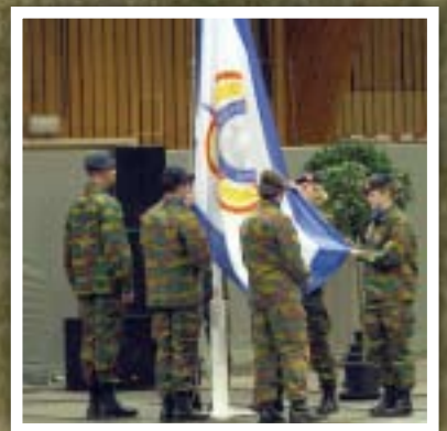
Hoisting of the CISM flag