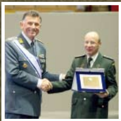
General Gola and Colonel Lupcin