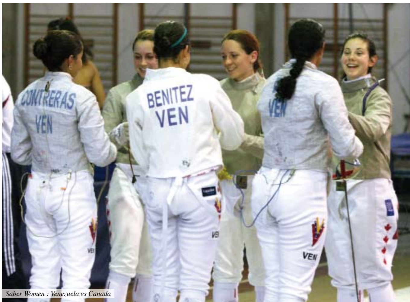
Saber Women : Venezuela vs Canada

En demi-finale, on retrouve deux Italiennes (Roberta Elefante et Francesca Bruccione), une Vénézuélienne (Alejandra Benitez) et une Polonaise (Aleksandra Socha) au palmarès éloquent : Championne d'Europe individuelle et par équipes en 2008, 6 e par équipes des JO de Pékin en 2008. Les deux demi-finales sont à sens unique. Socha domine largement Bruccione sur le score de 15-4. Benitez en fait de même avec Elefante, 15-5. La finale entre Socha et Benitez est une vraie opposition de styles entre une Benitez à l'escrime très classique et une Socha plus enlevée, plus inventive. Les deux prétendantes se tiennent jusqu'à 5-5 avant que la Polonaise ne lâche les chevaux pour s'imposer 15-10. La Pologne termine ces championnats comme elle les a commencé : avec deux médailles d'or individuelle et par équipes.