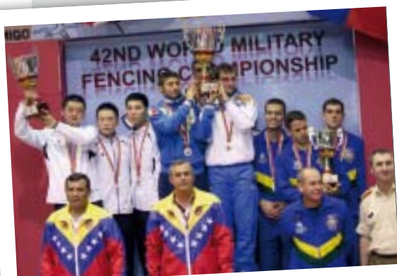
Foil Men Team Podium