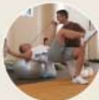
MIND AND BODY TRAINING