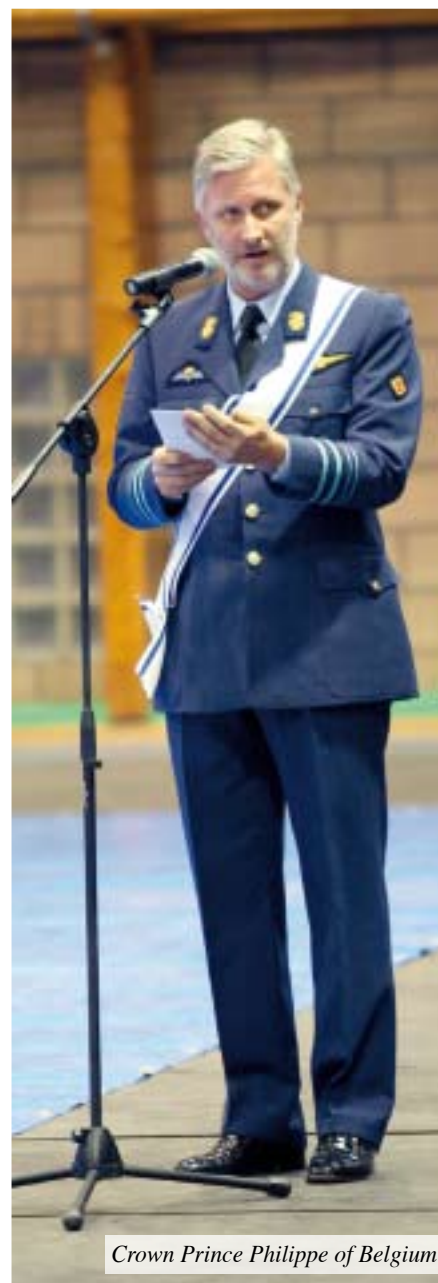
Crown Prince Philippe of Belgium