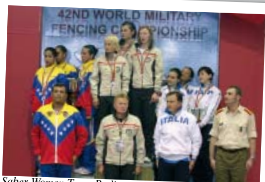
Saber Women Team Podium